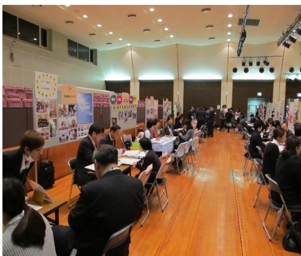
大ホール【高年齢・障害分野】