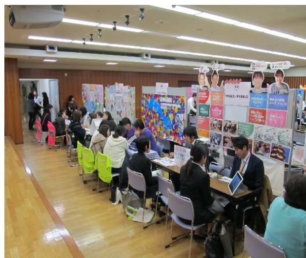
大会議室【保育分野】