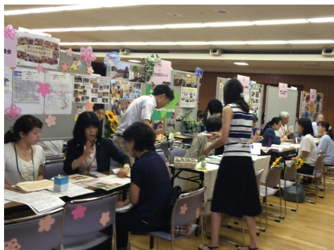
大会議室【保育分野】