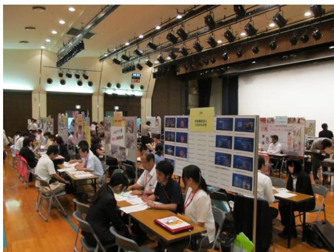
大ホール【高齢・障害分野】