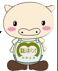
人材バンクキャラクター ほっとん