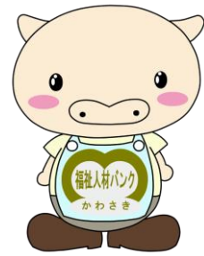
人材バンクキャラクター ほっとん