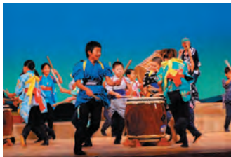
平間わんぱく少年団▶