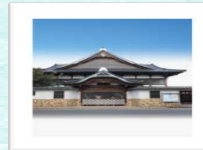
地域福祉情報バンクにて貸出中！

少子高齢化社会の到来で、次世代を担う子供たちの役割は極めて大きくその健全育成に向けて、公衆浴場が一助を担うことは大きな意義があります。また、ふれあい入浴としての場を提供することは、将来の利用者への道を開くことにあります。