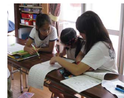
昨年度参加者の様子