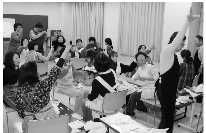
介護実習：今日も張り切ってまいりましょう！

今年度は現任者向けテーマ別研修、認知症介護実践者研修、フットケア研修、居宅介護従業者養成研修などさまざまな研修を開催予定です。詳しくはお問合せ下さい。